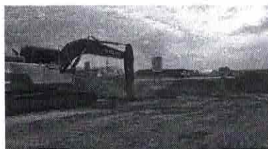
ALARGAMENTO DA BR-364

A reforma da ponte representa o cuidado da Concessionária com a segurança viária e compromisso da empresa em seguir investindo em todo o trecho sob concessão.