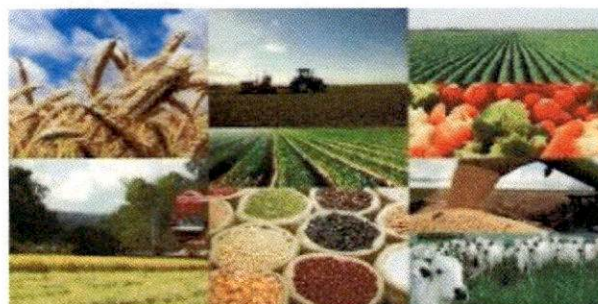
FORTE: MT ECONÔMICO