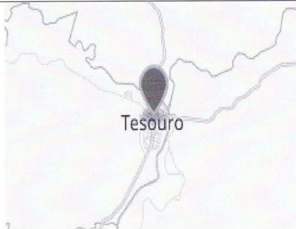
Mapa de Tesouro