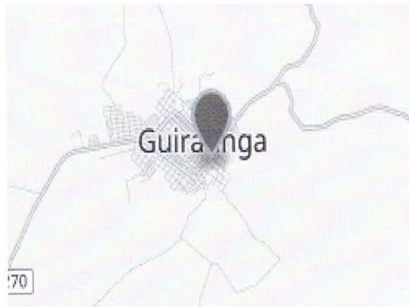
Mapa de Guiratinga

A lei nº. 664, de 10 de dezembro de 1953, de autoria do Deputado Clóvis Hugueney, criou o município de Tesouro, com território desmembrado do município de Guiratinga.