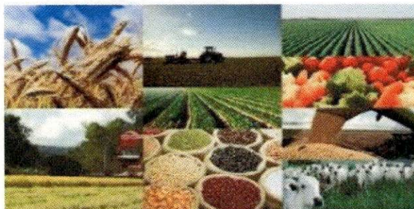
PONTE: MT ECONÔMICO