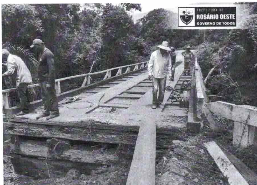
Imagem da ponte localizada sobre o córrego arraia, em Rosário Oeste

Cumprе ressaltar que a pretensão do projeto, visa denominar ponte BENANCI JOÃO ALVES NAZÁRIO, localizada sobre o córrego arraia, no município de Rosário Oeste, vejamos: